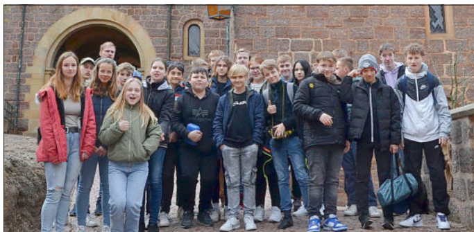
Eine abwechslungsreiche und interessante Führung durch die Burg ließ den Blick auf Thüringer Geschichte öffnen.

Dies wurde ihnen durch die Stiftung Westthüringen, deren Anliegen es ist, Gruppen die Thüringer Heimat näher zu bringen, ermöglicht.