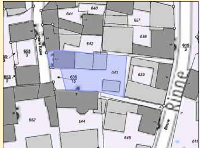
Luftbildaufnahme Untere Ecke 3, Lengefeld

Die Gemeinde Unstruttal ist nicht verpflichtet, an einen bestimmten Bieter zu veräußern.