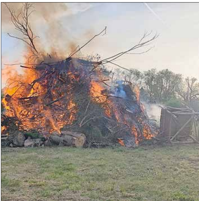
Das Maifeuer wird entzündet

Der Vorstand des Kirmes- und Faschingsverein Menteroda e.V.