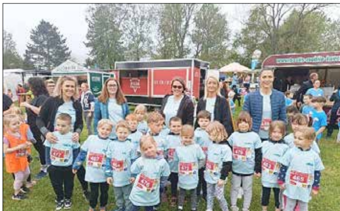
Das Team der Luhnewichtel