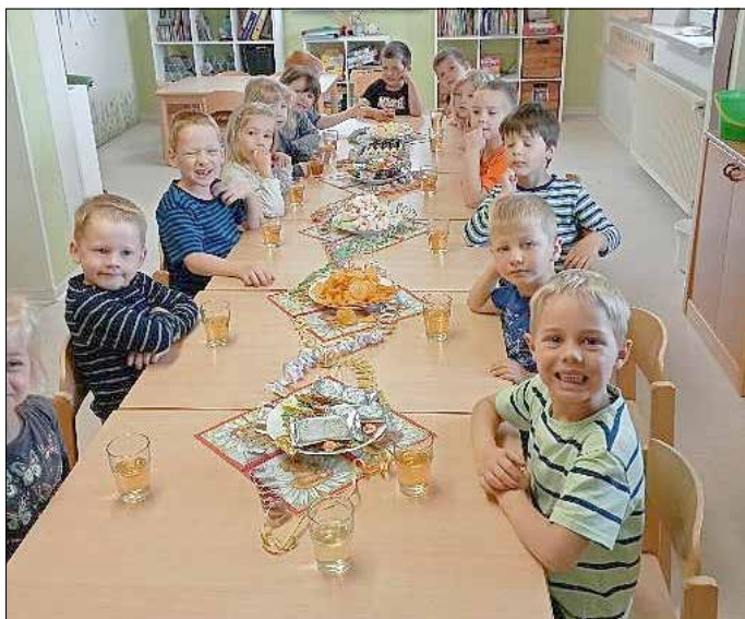
Das Team der Luhnewichtel

Dem Wetter zum Trotz feierten die Kinder und Erzieherinnen der Kita Luhnewichtel den Kindertag. Am 31.05.2024 wurde die Kita mit Luftballons geschmückt und der Tag startete mit leckeren Würstchen zum Frühstück. Anschließend wurde mit Musik und Tanz ausgiebig gefeiert. Das Naschen der mitgebrachten Leckereien kam natürlich nicht zu kurz. Als es sich dann die Sonne doch noch überlegt hat, für uns zu scheinen, ging die Party draußen weiter. Das Highlight des Tages waren coole Glitzertattoos. Alle Luhnewichtel hatten einen tollen Tag.