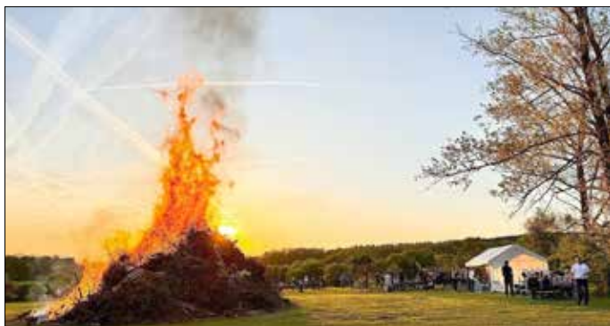
Andreas Frey Vereinsvorsitzender Feuerwehr

Wer noch Baumschnitt anfahren möchte, hat dazu noch bis zum 25.4. Zeit, dann wird der Haufen aufgeschichtet. Es wird ausdrücklich darauf hingewiesen, dass lediglich Baumschnitt und unbelastetes Holz verbrannt werden darf. Andere Materialien, wie auch Grünschnitt und Haushaltsabfälle dürfen nicht angeliefert werden. Diese Art der Entsorgung stellt eine Ordnungswidrigkeit dar und wird zur Anzeige gebracht.