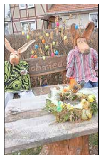
DW vom Kanal Dachrieden