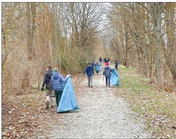
Die Schüler und Lehrer der Primarstufe der TGS Menteroda