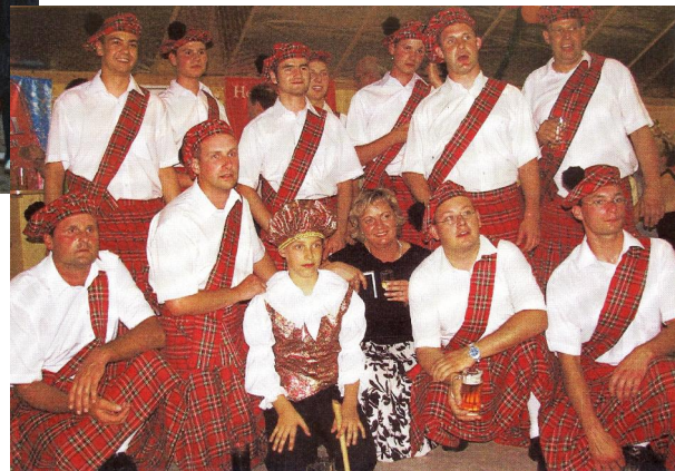
Show - Mans