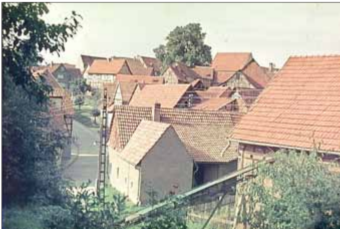
Dorf ohne Kirchturm