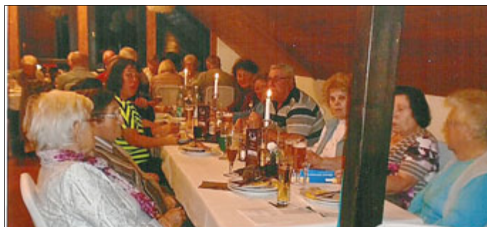
E. Wolter OG Ammern

Ihnen „Allen“ wünschen wir eine gesegnete Weihnacht und ein gesundes erfolgreiches Neues Jahr 2020.