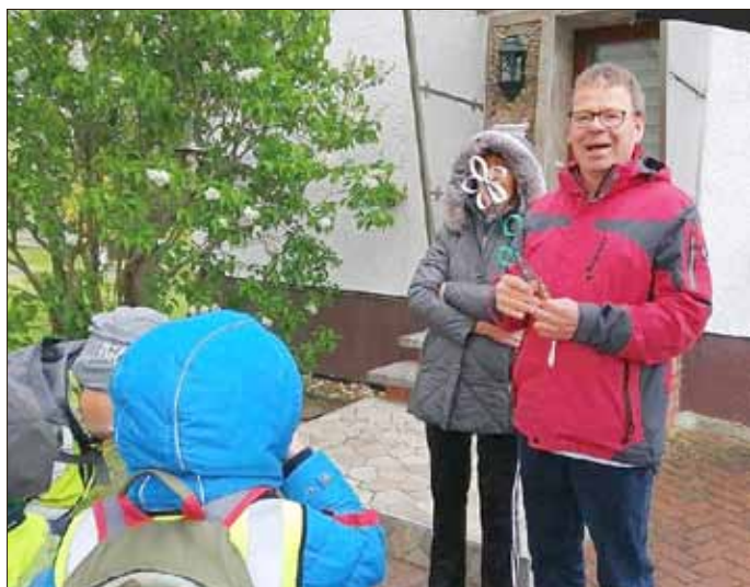
Das Team der „Unstrutspatzen“