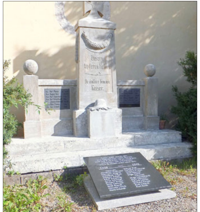
Denkmal saniert 2019

Das Denkmal und die Tafeln mit den Namen unserer Gefallenen und Vermissten aus beiden Weltkriegen konnte bereits saniert werden.