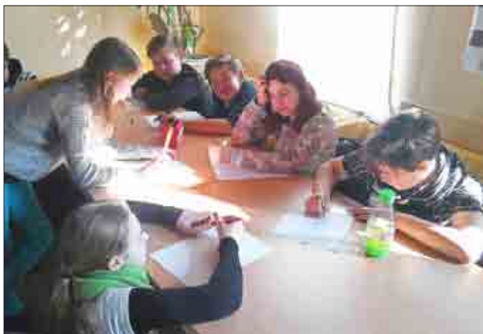
Hier arbeiten die Schüler der Kl.6a in Gruppen das Täter-, Helfer- und Opferprofil heraus