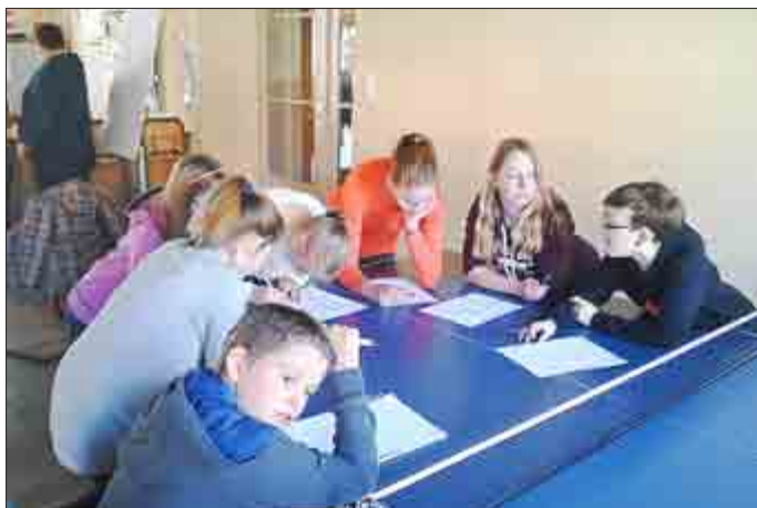
Arbeit in Gruppen in Auswertung des Medienfilms