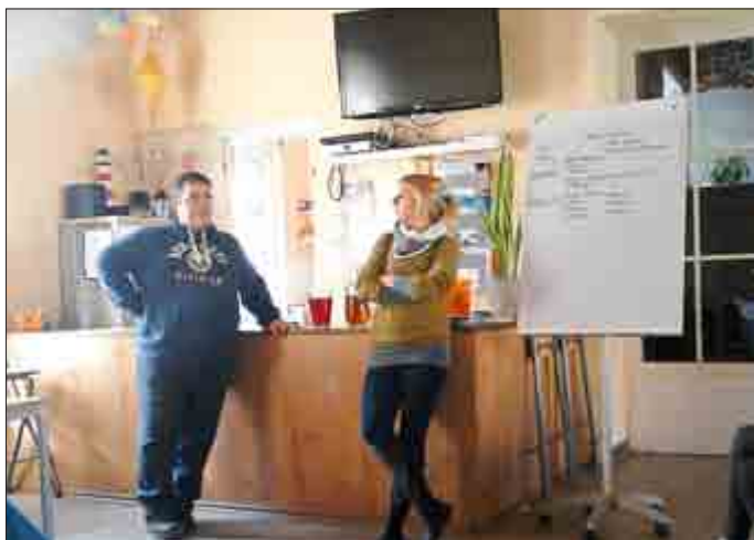
Die Projektleiter im Gespräch mit den Schülern der Kl.6a